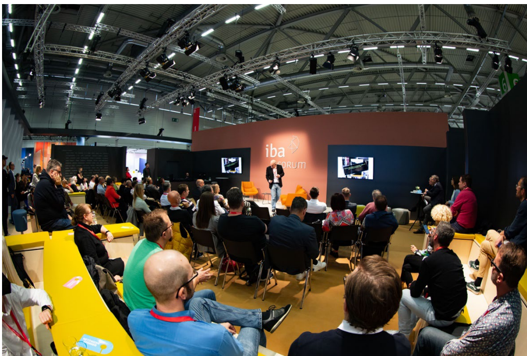
Die Themen zu Büro und Kultur fanden während der gesamten Messe großen Anklang.