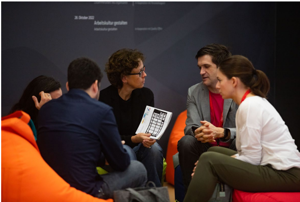
Die Besucher der ORGATEC nutzen schon vor Ort jede Möglichkeit, zum Austausch über das Gesehene und Gehörte.