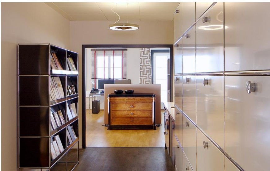
Vintage-Möbel setzen in der modernen Bürolandschaft gemütliche Akzente.